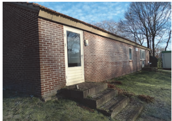
Figuur 6: Vooraanzicht sanitairgebouw minicamping