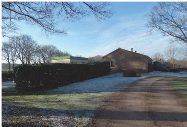
Figuur 7: Aanzicht sanitairgebouw vanaf de oprit