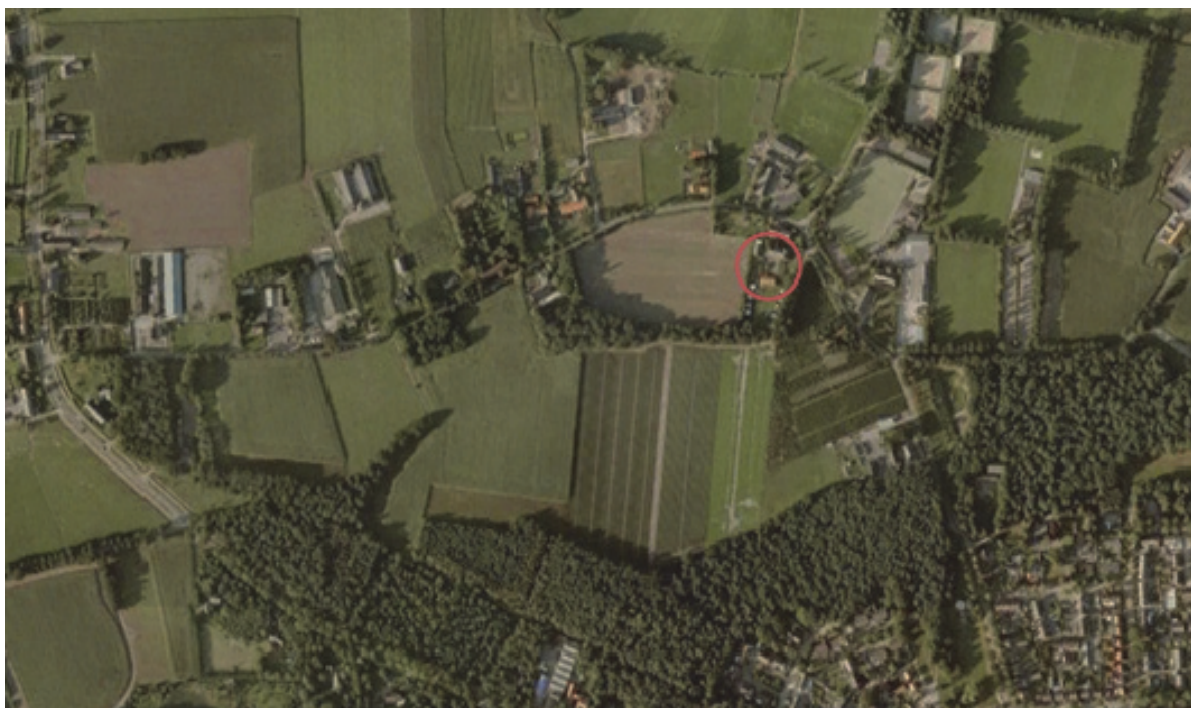
Figuur 1: Luchtfoto plangebied

De woning aan Geneineind 1 te Bakel ligt in het buitengebied van de gemeente Gemert-Bakel op circa 700 meter ten noorden van de kern Bakel. De directe omgeving van het plangebied kenmerkt zich door agrarisch grondgebruik, in hoofdzaak akkerbouw. In de omgeving zijn verspreid liggende burgerwoningen, agrarische bedrijfswoningen en agrarische bedrijven aanwezig. De Amersfoortcoördinaten van het midden van het plangebied zijn X= 179,276 , Y= 391,291 . Het plangebied is rood omkaderd weergegeven op de luchtfoto (figuur 1) en topografische kaart (figuur 2).