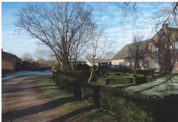
Figuur 5: Vooraanzicht plangebied vanaf de oprit