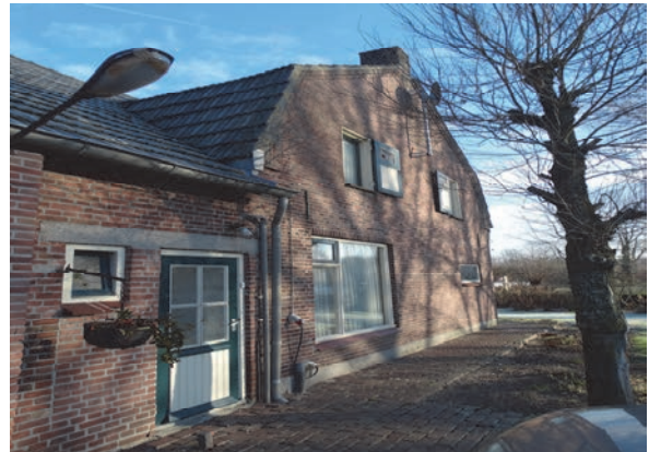
Figuur 8: De te splitsen boerderij