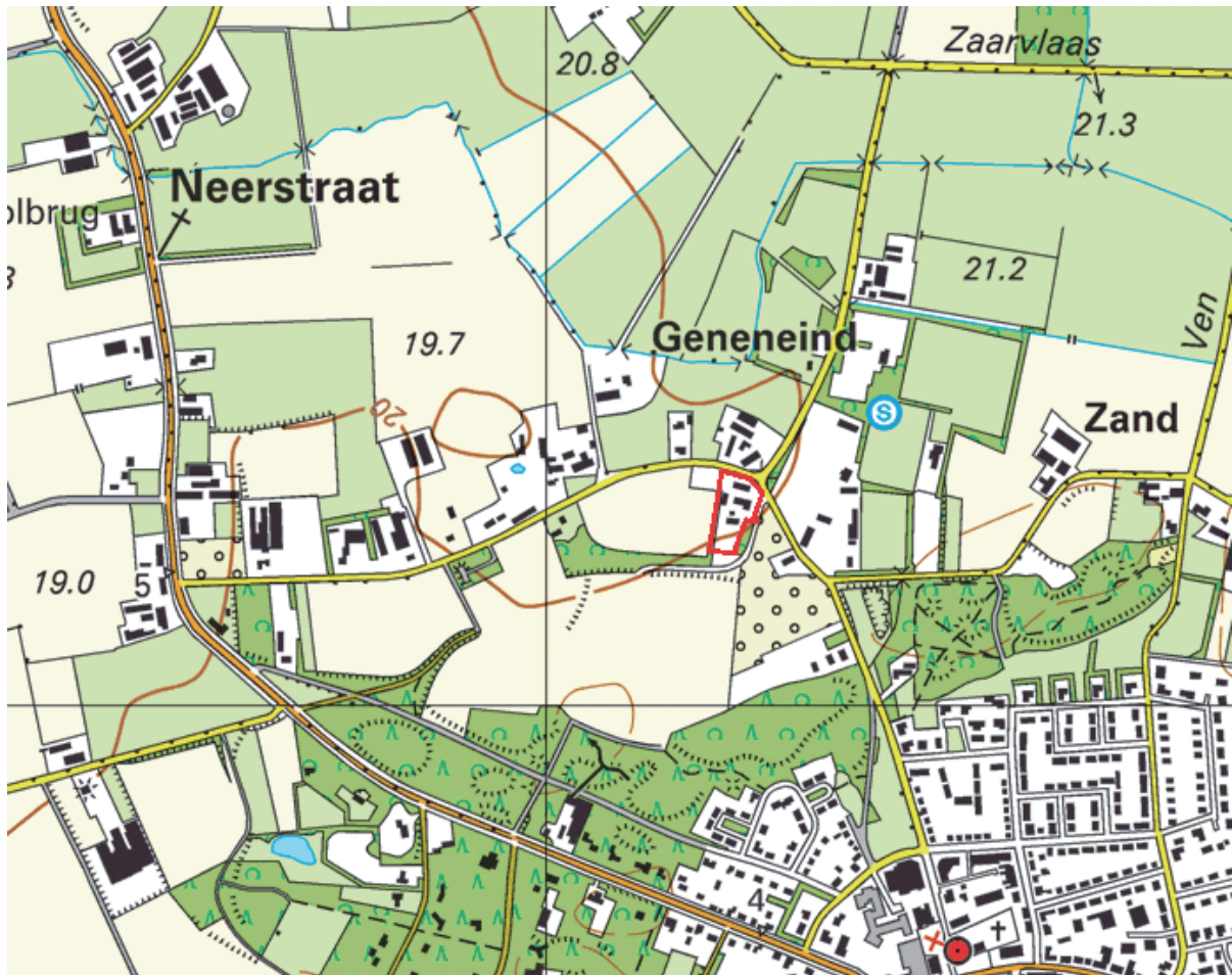
Figuur 2: Topografische kaart plangebied