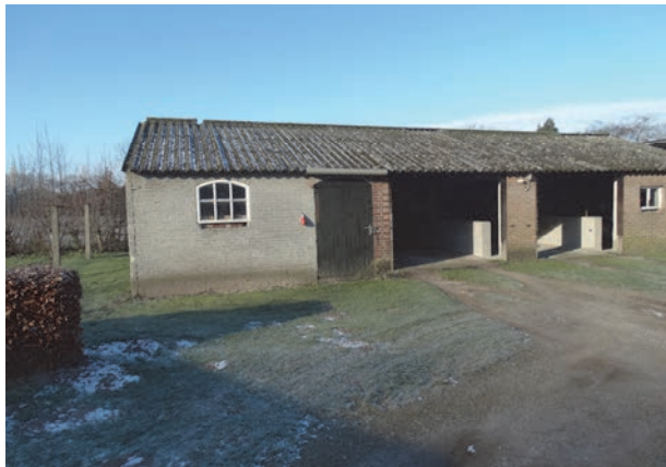
Figuur 3: Vrijstaande garage/ berging