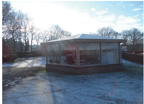
Figuur 4: Het te slopen prieel