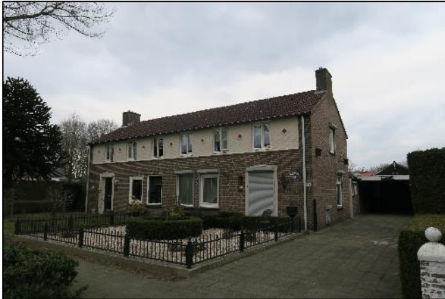
Foto 1. Woningen aan de Nieuwe Uitleg