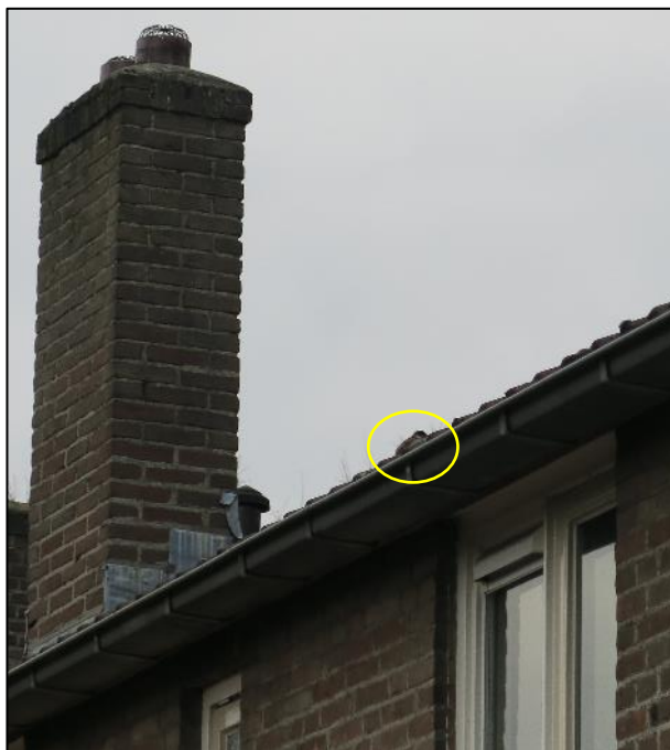
Foto 5. Achterzijde Nieuwe uitleg 32 met huismus bij de dakrand (gele cirkel).