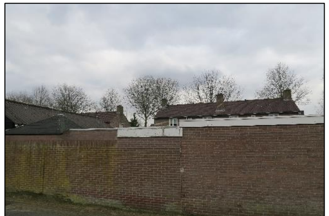
Foto 4. Achterzijde woningen Nieuwe uitleg vanaf De Bremmen