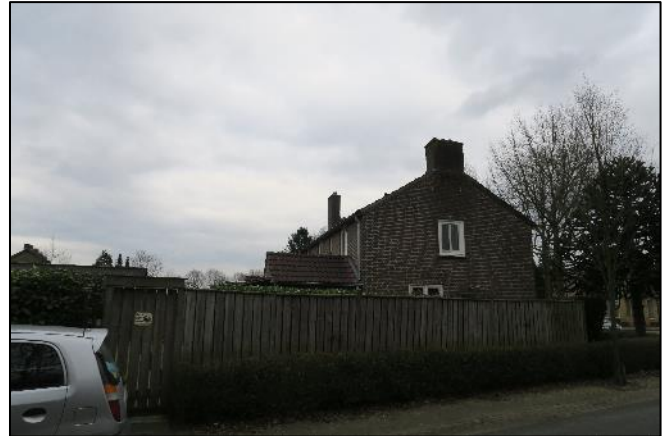
Foto 2. Westgevel Nieuwe uitleg 32