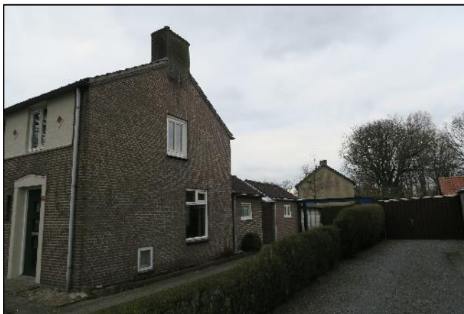
Foto 3. Oostgevel Nieuwe uitleg 26