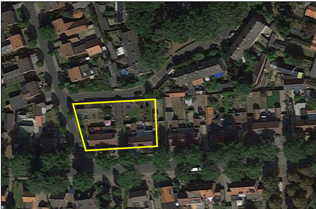
Figuur 2. Globale begrenzing van het plangebied (gele lijn)