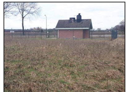
Figuur 8. Pomphuisje op onderzoekslocatie.