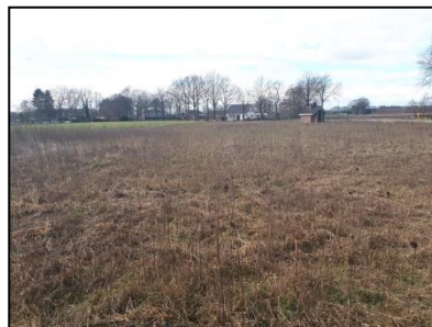
Figuur 4. Overzicht onderzoekslocatie.