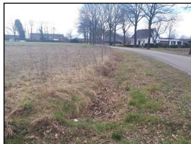
Figuur 7. Noorzijde onderzoekslocatie.