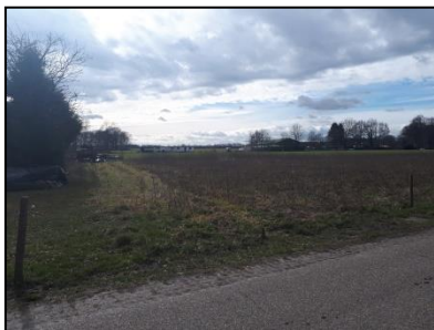
Figuur 3. Noordzijde onderzoekslocatie.