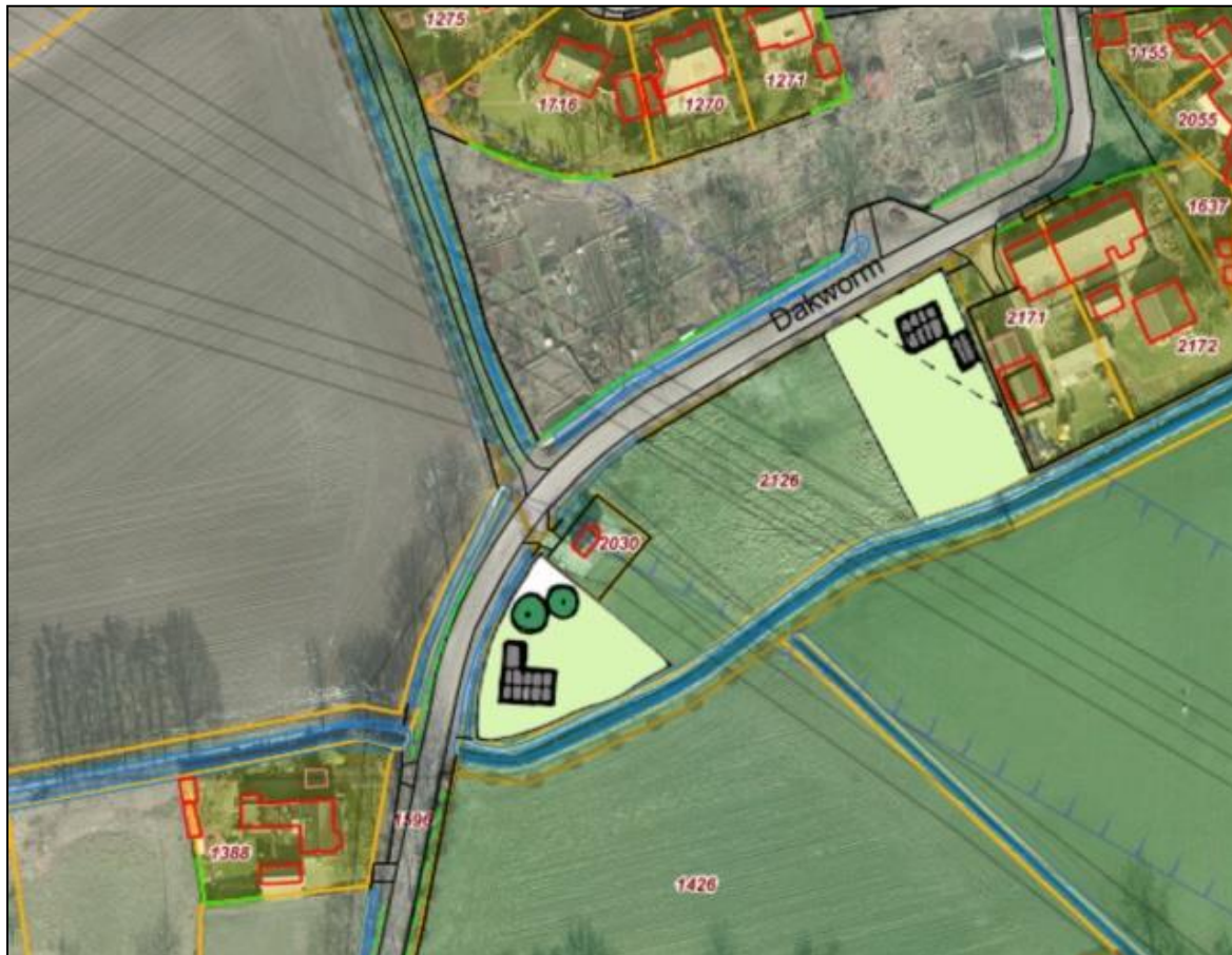
Figuur 9. Toekomstbeeld projectlocaties.

De initiatiefnemer is voornemens op beide projectlocaties een woning met tuin te realiseren (figuur 9).