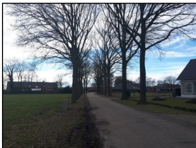
Figuur 6. Bomenlaan ten noordwesten van onderzoekslocatie.