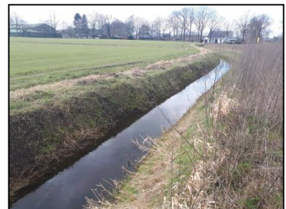
Figuur 5. Watergang ten zuiden van onderzoekslocatie.