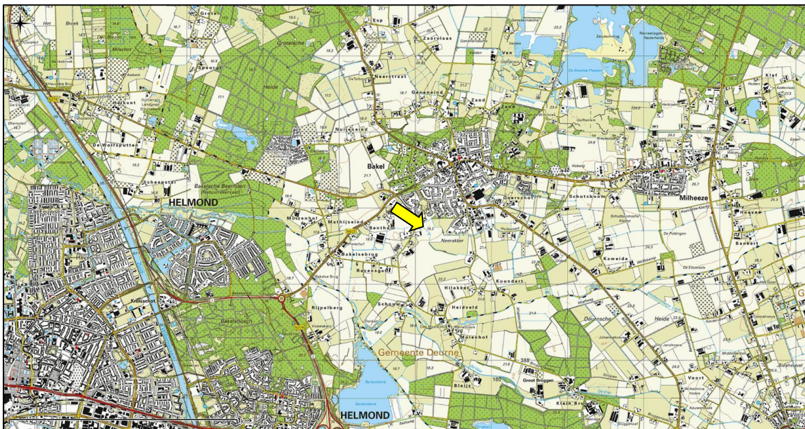
Figuur 1. Topografische ligging van de onderzoekslocatie.

Volgens de topografische kaart van Nederland, kaartblad 52 B (schaal 1:25.000), zijn de coördinaten van de meest zuidelijke projectlocatie X = 179.017 Y = 389.771 .