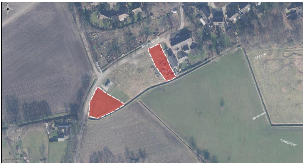
Figuur 2. Luchtfoto projectlocaties en directe omgeving.