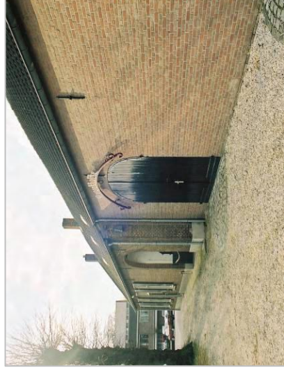
Traditioneel gevelbeeld van een voormalige boerderij.