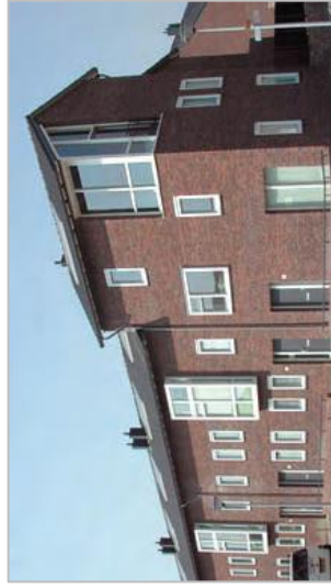
Bebouwingsaccent op een bijzonder punt door afwijkende hoogte en vorm.