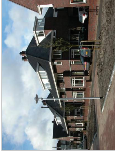
Gevarieerd gevelbeeld met stenen erfafscheiding en het straatprofiel op één niveau.