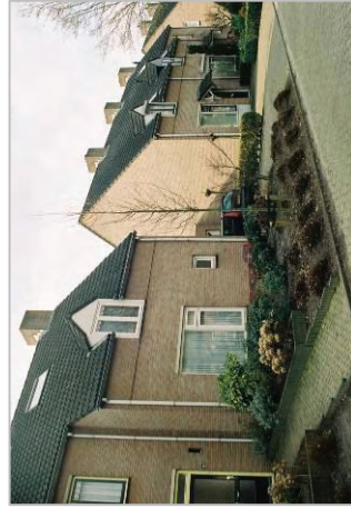
Verspringing in de rooilijn binnen één bouwmassa.