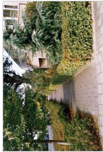
Groene haag versterkt het groene karakter van de straat.

situëren. Het gaat hierbij bijvoorbeeld om belangrijke hoekpunten, verbijzonderingen in het straatbeeld en einde van zichtlijnen. Deze accenten kunnen op een aantal punten afwijken van de belendende bebouwing (bijvoorbeeld qua detaillering, kleur- en materiaalgebruik, massa, vorm, gevelkarakteristiek en/of plaatsing). Accenten mogen dan ook in de aan de voorzijde gelegen perceelsgrens gesitueerd worden.