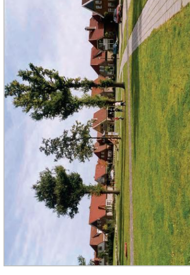
Woningen aan een park, met een bomengroep en enkele speeltoestellen.