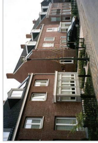
Gevarieerd gevelbeeld binnen één bouwmassa en dieptewerking door de toepassing van erkers.