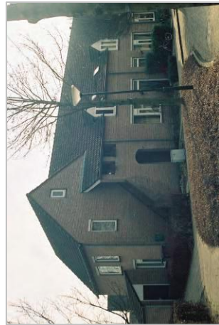
Gevarieerde dakopbouw door wisselende noklijn, hoogtes en de toepassing van dakkapellen.

Een aantal eisen ten aanzien van beeldkwaliteit geldt voor het gehele woongebied. De bestaande kenmerkende bebouwing in het centrum van Bakel is als uitgangspunt genomen voor deze beeldkwaliteits-eisen. De bebouwing in het centrum wordt gekenmerkt door subtiele verspringingen in de gevels en daken die variëren in hoogte, nokrichting en vorm. De bebouwing is opgebouwd uit roodbruine bakstenen met donkergekleurde dakpannen als dakbedekking. Het bebouwingsbeeld heeft een kleinschalig en speels karakter, waarbij het kleur- en materiaalgebruik voor de samenhang zorgt.