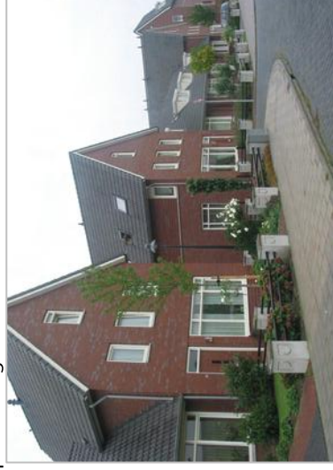
Gevarieerd bebouwingsbeeld door afwisselende nokrichting en dieptewerking.