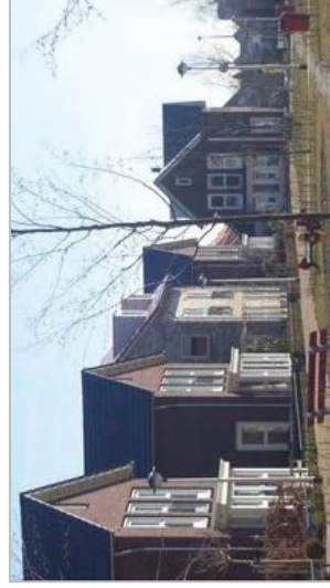
Bebouwingsaccent door afwijkende dakvorm.