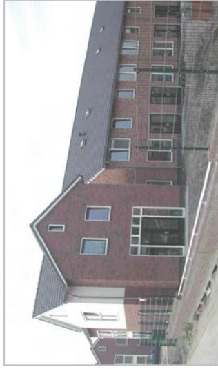
Tweezijdig georiënteerde hoekwoning,