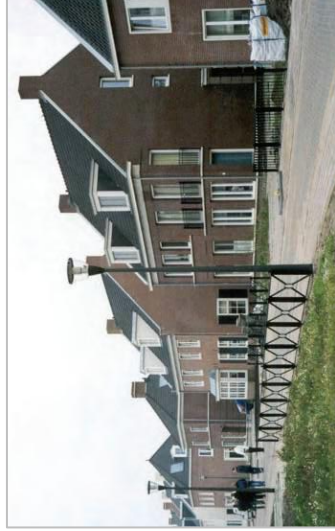
Gevarieerd gevelbeeld, zowel per bouwmassa als per woning.