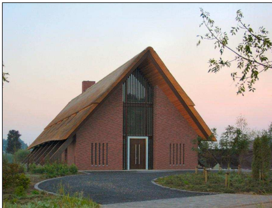
Eigentijdse “boerderij” nabij Veghel/Mariaheide van het architectenbureau Leenders.

Dat vinden mensen immers mooi en het voorkomt de miskleunen die in de afgelopen zestig jaar zijn gebouwd. Belangrijkste is dat mensen weer leren hun eigen woning te bouwen door gereedschap aan te bieden dat vertrouwd en bekend is. Uit het principe van het agrarische huis kan een nieuw huis groeien. Een huis dat zich een houding geeft in zijn omgeving. Een huis met karakter, maar wel een Bakels, een Gemerts of Millus karakter. Sommigen zullen er voor kiezen alles zo historisch mogelijk terug te bouwen, anderen zullen voor een eigentijdse vertaling kiezen. En een enkeling zal wellicht voor grensverleggende architectuur kiezen. Die ruimte moet er altijd blijven, mits gedragen door goede argumenten. Noem het dorpsverfraaiing of decorbouw, punt blijft dat we behoeften hebben aan ankerpunten, vertrouwde plekken waar we kunnen schuilen. Het vertrouwde agrarische of edele huis biedt daarvoor in de huidige snelle tijd de beste garantie.