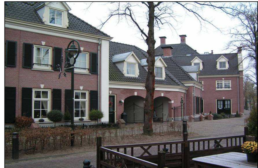
Een voorbeeld van historisch geïnspireerd bouwen staat in Beek en Donk. Het complex heet "De Zeven Zusters" en is van Friso Woudstra architectenbureau. Er is hier gekozen voor een traditionele interpretatie.