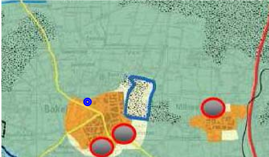
Figuur 2: fragment uitwerkingplan zuidoost Brabant / regionaal structuurplan