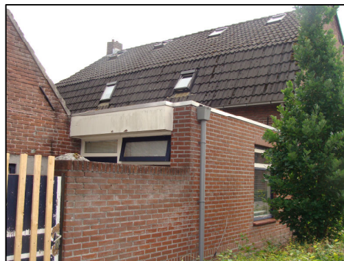
Foto 2. Achterzijde nr. 72 en 74