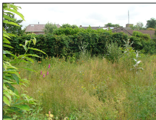
Foto 4. Tuin Prinses Irenestraat 80