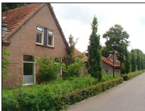
Foto 3. Woning Prinses Irenestraat 80