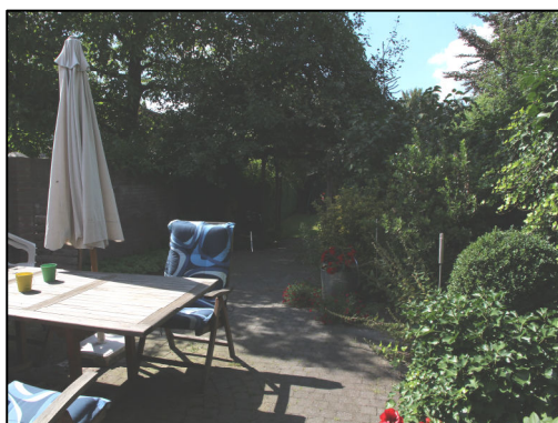
Foto 3. Tuin Prinses Irenestraat 74.