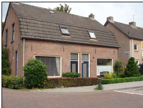
Foto 1. Woonhuizen Julianastraat 72 en 74