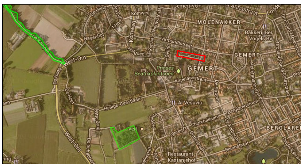
Figuur 4. Plangebied (rood) ten opzichte van de EHS (groen)

Zoals blijkt uit de gebiedendatabase van het Ministerie van EZ en de gegevens van de provincie Noord-Brabant maakt het plangebied geen onderdeel uit van de EHS (figuur 4). Het dichtstbijzijnde gebied dat behoort tot de EHS ligt ongeveer 550 meter ten zuidwesten van het plangebied.