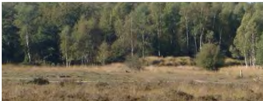
Afbeelding 1, referentiebeeld afwisseling tussen bos en open landschap (hier met een vrij abrupte bosrand)

Naast de kleine open plekjes bevindt zich in een deel van het bos een tweetal grotere open plekken. Deze plekken hebben vanuit zowel recreatief als ecologisch oogpunt een meerwaarde door de variatie die hiermee ontstaat in het bos. De open plekken zijn begroeid met een schrale vegetatie van grassen en kruiden. De grens tussen bos en open plek is plaatselijk abrupt en op andere plaatsen juist geleidelijk.