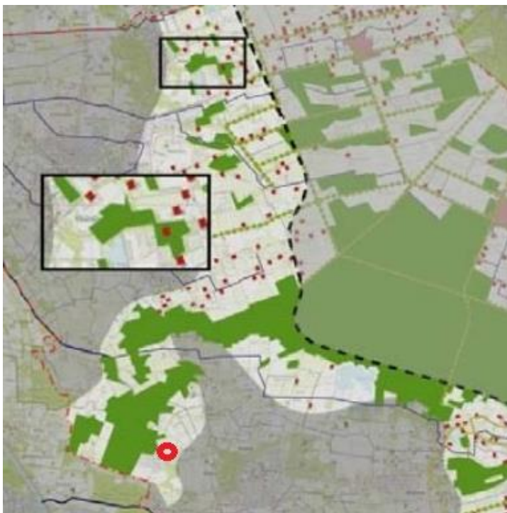
Afbeelding: locatie in het gebied van de eerste heideontginningen. De locatie ligt in de rode cirkel. De afbeelding is overgenomen uit het Beeldkwaliteitplan.

De locatie Nuijeneind 18 ligt in het gebied van de eerste heideontginningen. Kenmerkend is de afwisseling van openheid en beslotenheid. De open akkers en weilanden worden afgewisseld met kleine en grotere bospercelen. Dit zorgt voor een mozaïekstructuur. De ontgonnen percelen werden omzoomd met elzenheggen en houtwallen. De percelering is regelmatig.