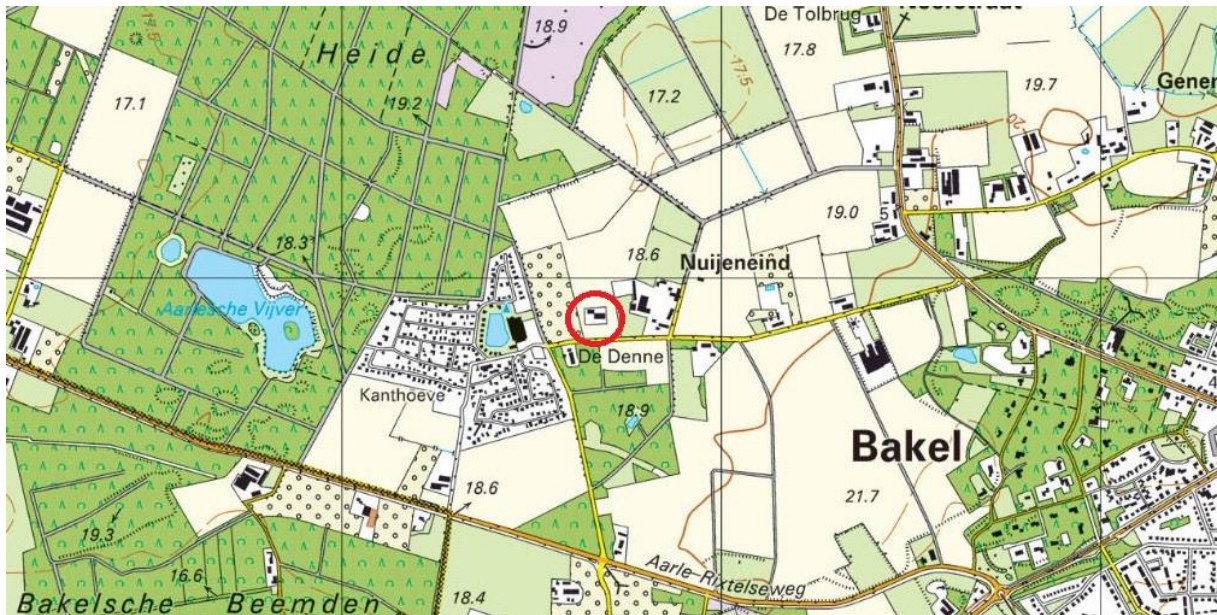
Afbeelding: huidige situatie landschap. De locatie ligt in de rode cirkel.