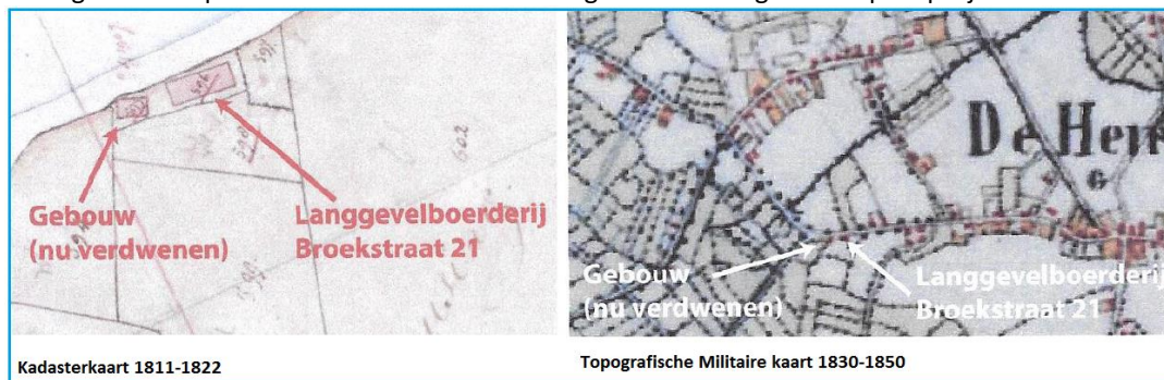
Figuur. Uitsnede Kadasterkaart 1811-1822 en Topografische Militaire kaart 1830-1850

Uit historische kaarten blijkt dat er op de projectlocatie, ten westen van Broekstraat 21, in ieder geval in de periode 1811-1926 en later een gebouw heeft gestaan op de projectlocatie.