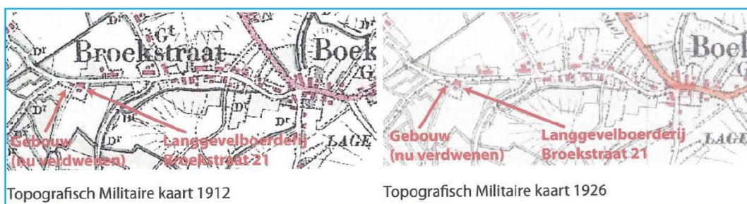
Figuur. Uitsnede Topografische Militaire kaart 1912 en 1926

Er is onderzoek gedaan door Design & Construct naar de vraag of het gebouw op de kaart een schuur of een woning betreft. Daarvoor zijn diverse brondocumenten geraadpleegd.