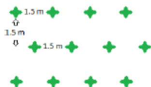
Afbeelding 4: planten in driehoeksverband

Struwelen: plantafstand 1,5*1,5 meter in driehoeksverband (zie afbeelding 4)