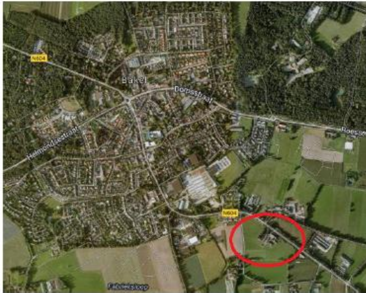
Afbeelding 1: Globale ligging van het plangebied. De locatie (Oldert 2, Bakel) wordt aangeduid met de rode cirkel.