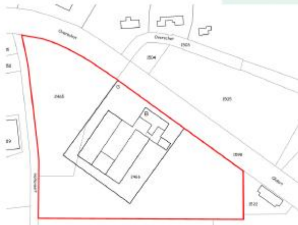
Afbeelding 2: Begrenzing van het plangebied. Bron: situatieschets Oldert 2 te Bakel, 05-12-2014