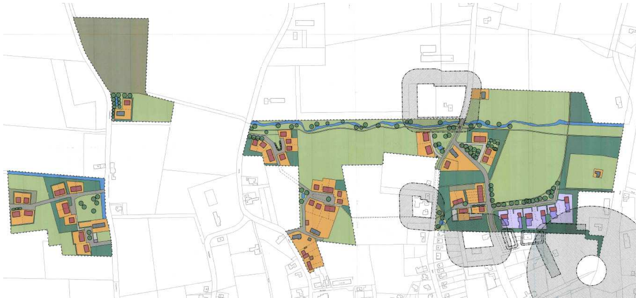
Inrichting erf en landschap