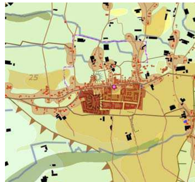
Verstedelijking na 1955 (bruin) en varkenshouderijen (zwart)