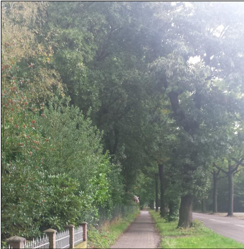
Foto 1 bestaande laanbomen Handelseweg