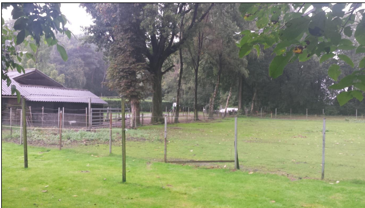
Foto 3 berkenbomen in slechte conditie (achterzijde toekomstige woning)