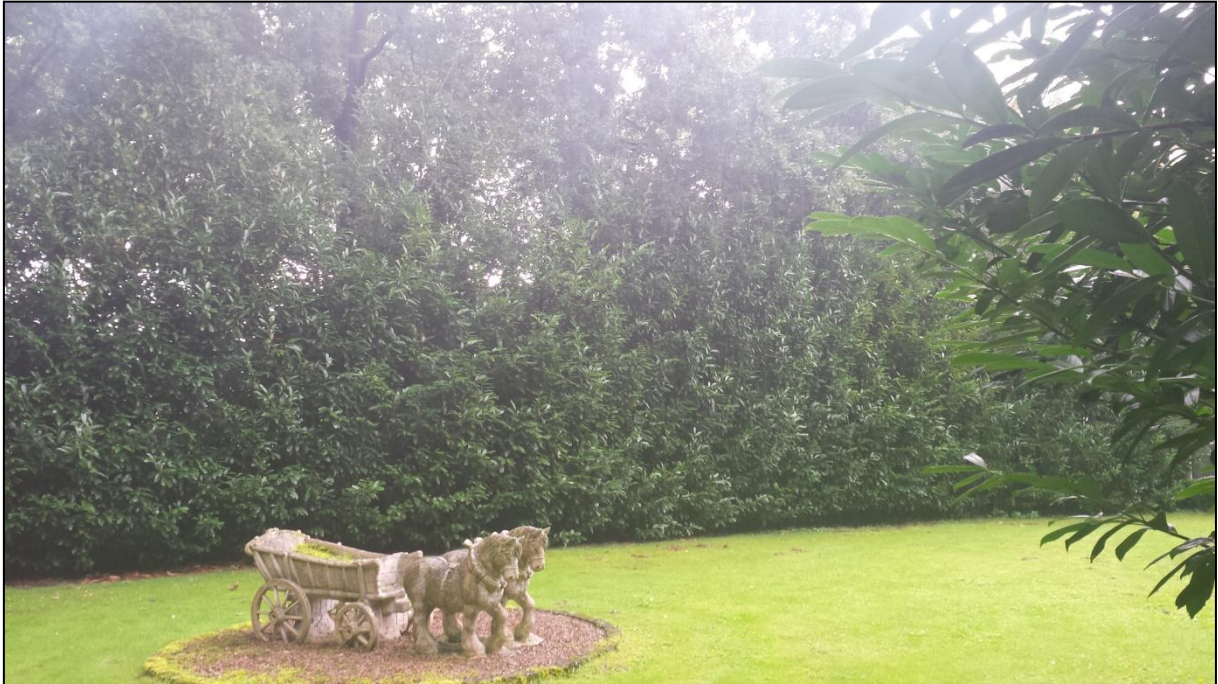
Foto 5 huidige singel, bestaande uit laurier