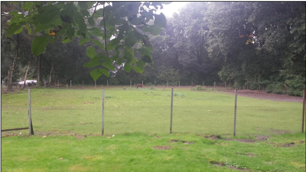
Foto 2 bestaande beplanting rondom plangebied