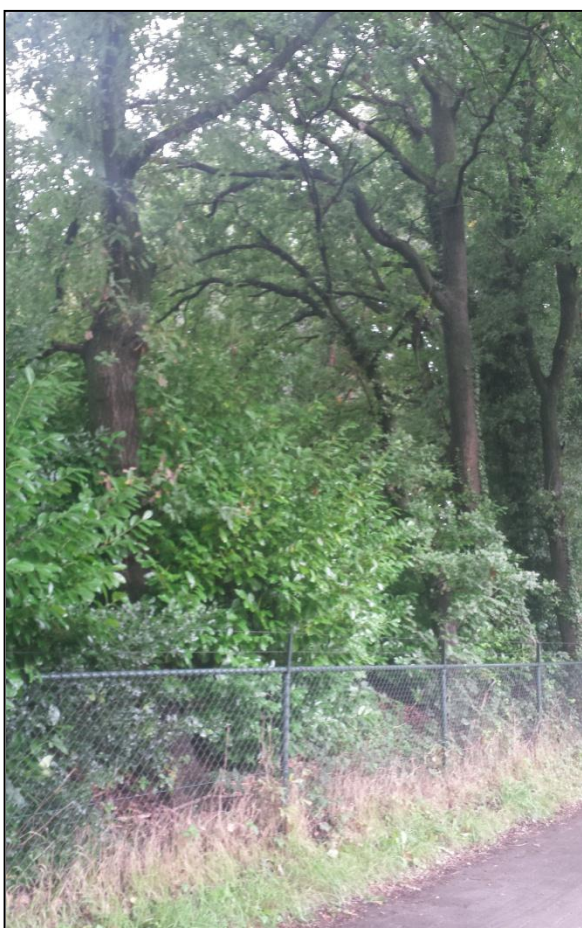
Foto 4 eikenbomen in slechte conditie (voorzijde toekomstige woning)