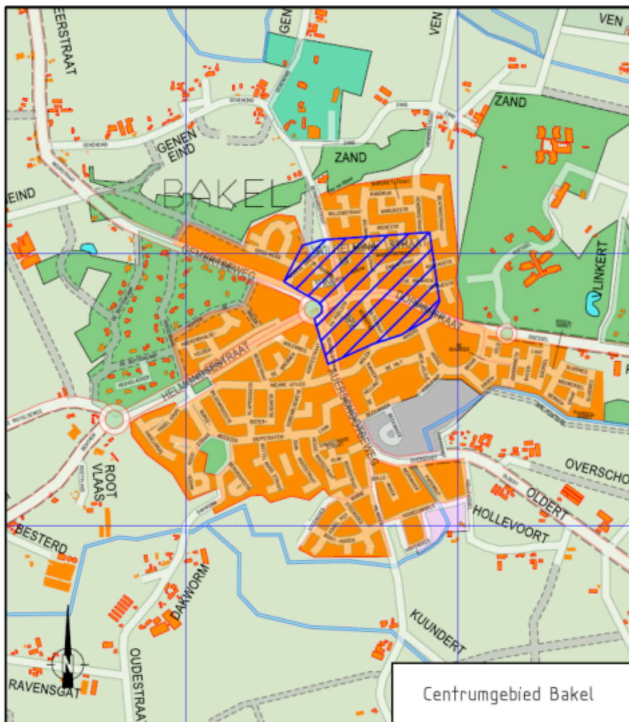
Figuur 2: centrumgebied Bakel