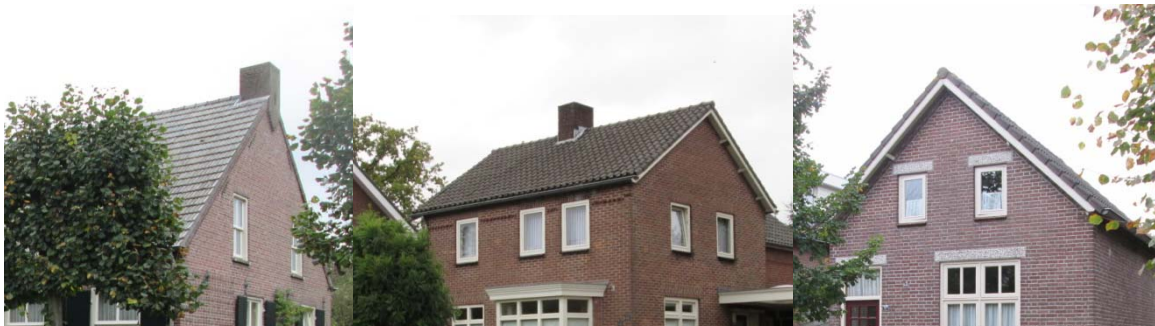
Toepassing van een zadeldak

Het huidige straatbeeld laat een variatie aan daktypen zien, waaronder zadeldaken, mansardedaken en enkele puntdaken. De voorname kaprichting is parallel aan de straat, op uitzondering van enkele verbijzonderingen bij zijwegen, waar sporadisch een kaprichting loodrecht op de hoofdstraat te vinden is. Ter geleiding van de weg wordt op de beoogde locatie een zadeldak of mansarde dak die parallel loopt aan de Pastoor Castelijnsstraat.