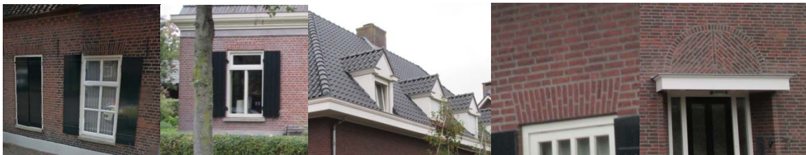
De detaillering in de gevel met raamblinden, dakkapellen, raambogen en gootlijsten

Per bouwvolume is er sprake van een uniformiteit in geveldetails. De genoemde raamblinden, maar ook gootlijsten, gemetselde raambogen, kleine dakkapellen of dieptewerking door reliëf in metselwerk kunnen onderdeel zijn van die details.