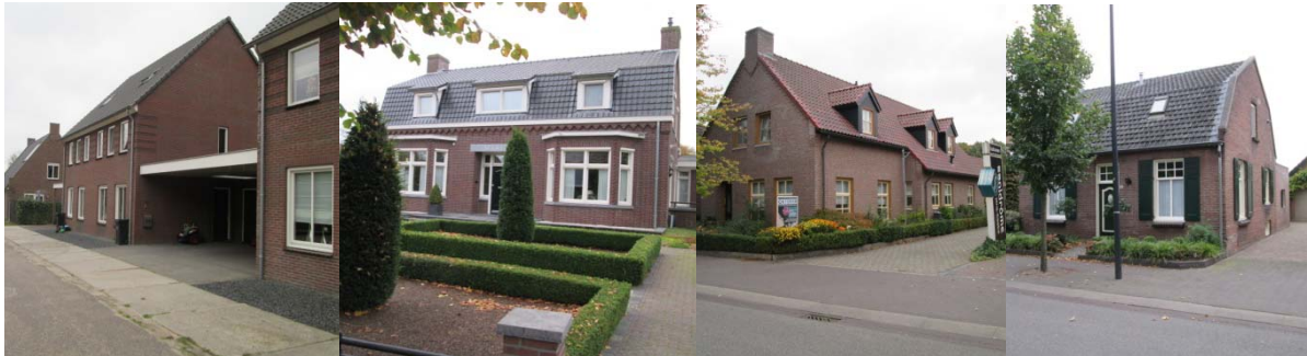
Variatie in aantal bouwlagen en verdiepingshoogte

De huidige bebouwing aan de Pastoor Castelijnsstraat bestaat uit een variatie van volumes met een enkele bouwlaag met kap en volumes met twee bouwlagen met kap. Door de toepassing van een verschil aan verdiepingshoogte ontstaat er een variatie in goot- en bouwhoogte. Om aan te sluiten op het huidige straatbeeld is de maximale grootte van de beoogde bebouwing beperkt tot maximaal twee lagen met kap met een traditionele goothoogte van ten hoogste 6 meter.