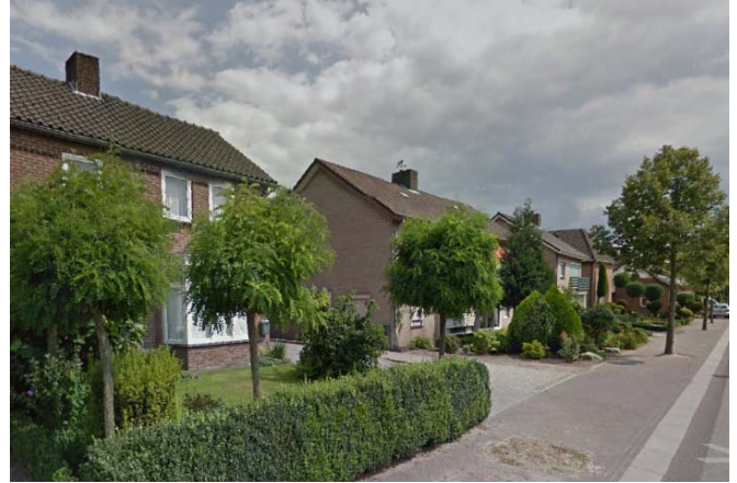
Opeenvolging van halfopen en gesloten individuele massa's