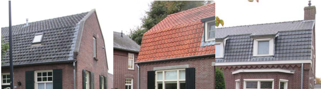
Toepassing van een mansardedak