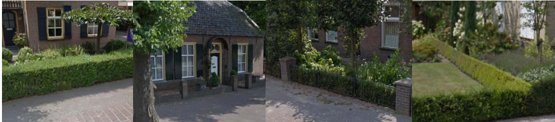
Overgangen privé - openbaar en overgangen tussen percelen via hagen, lage muurtjes of lage open hekwerken

De karakteristieke overgang tussen de woningen en de openbare ruimte vind voornamelijk plaats middels een kleine voortuin. Deze tuin kan worden omzoomd door een lage haag, lage muur of een laag open hekwerk. Tussen losse percelen in heeft een groene perceelsovergang ook de voorkeur.