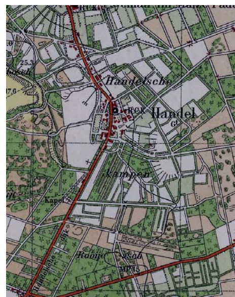
Historische Kaart (1930)

De karakteristiek van de lintbebouwing betreft een gegroeide kleinschaligheid die middels individuele ontwikkelingen plaatsvindt. Ieder gebouw staat zowel op zichzelf, alsmede dat het onderdeel is van de ritmiek van het straatbeeld. Het historische karakter van het huidige lint wordt daarom voornamelijk bepaald door de positionering van de bebouwing ten opzichte van het lint in de ritmiek en rooilijn van bestaande bebouwing; de massa, vorm, en kapvorm van de bebouwing zelf; de gebruikte materialen, geveldetailering en de overgang tussen woningen en de straat.