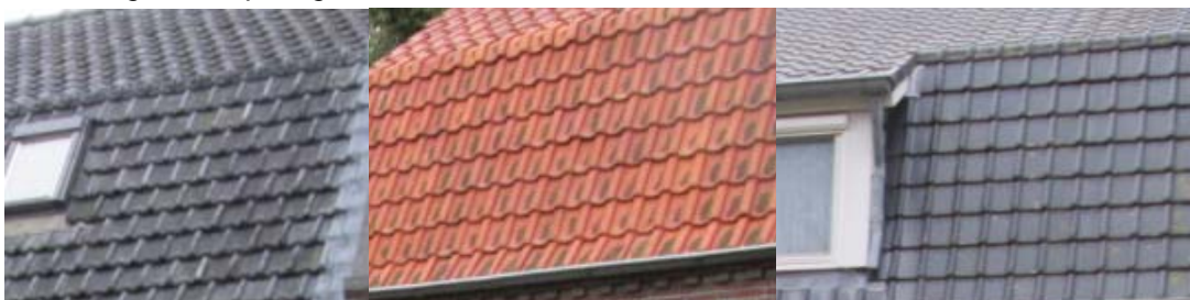
Materiaalgebruik daken: keramische dakpannen