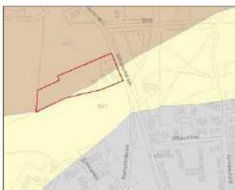
Bodemkaart van het plangebied

Het plangebied ligt op een dekzandrug (geomorfologische kaart) op de scheiding tussen een hoge zwarte enkeerdgrond (in het noorden) en een duinvaaggrond (in het zuiden).